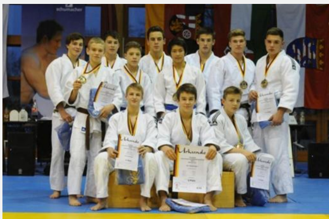
Unser erfolgreiches U17 Team bei der Deutschen Mannschaftsmeisterschaft